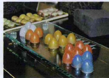
* L'ultimo nato di Giraudi si chiama Make Up: sono dei "brillanti" cioccolatini assortiti