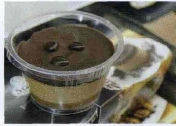
* Uno tra i tanti deliziosi minidesert della linea Excellence proposti da Solo Italia