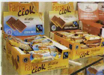
* I Farro Ciok, squisiti snack di biscotto e cioccolato dell'azienda bio Alcenero