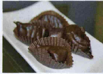
* Cioccolatini i cui deliziosi ripieni alla frutta sono creati dall'azienda calabrese Favella