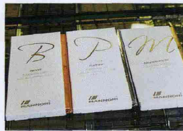
* Blend, Parfum e Monovarietà: tre grandi tavolette proposte da Mannori