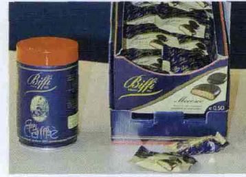
* Incartati uno ad uno, ecco i fragranti minisnack presentati da Biffi Milano 1852