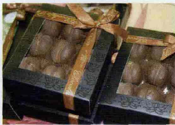
* Una delle mille delizie proposte da I Peccatucci di Mamma Andrea