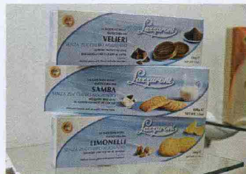
* Le delizie Senza Zucchero: Velieri, Samba e Limonelli, sono ricette di Lazzaroni