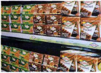
* Tra le proposte Sojasun anche Plaisir Chocolat, una bevanda al 100 % vegetale