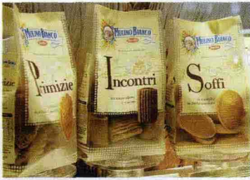
* Primizie, Incontri e Soffi: tre squisitezze di Barilla presentate con un nuovo packaging