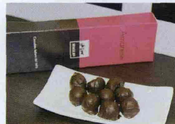
* Mini praline al fondente con un'amarena come ripieno: una chicca di Maglio