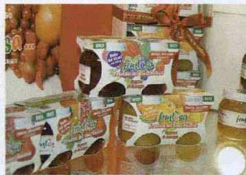
* Fruttosa, solo 60 calorie per 100 g, ecco la squisita frutta al cucchiaino di Rigoni di Asiago