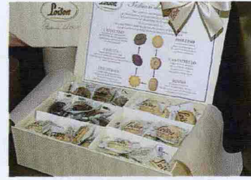
* Una fantastica scatola da degustazione con sei tipi di biscotti presentata da Loison