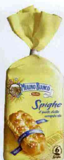
INIZIO SOFFICE Dolci e morbide Le Spighe Mulino Bianco (€ 2,15).