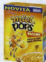
MIELE CROCCANTE Cereali golosi Miel Pops Palline Kellog's (€ 3,10).