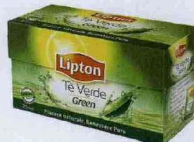
BENESSERE IN TAZZA Il Tè Verde Green Lipton (25 filtri € 1,98, 50 € 3,39).