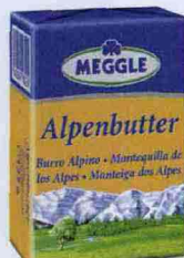
BURRO ALPINO L'Alpenbutter Meggle nel nuovo panetto da 125 g.