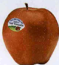
STAR(K) DELLE MELE La mela Stark del Consorzio Val Venosta (€ 1,75 al Kg).