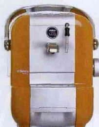
DESIGN A COLAZIONE Limited edition per Lavazza A modo mio (€ 159).