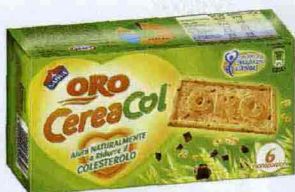
FIBRE E CEREALI È ricco di Omega3 l'Oro Cereacol Saiwa.