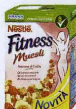
MUESLI GOLOSO "Passione di frutta" di Fitness Muesli Nestlé (€ 3,09).