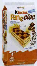
PANE E CIOCCOLATO Golosa e morbida la Kinder Pan e Cioc Ferrero (€ 2,90).