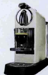
CAFFÈ CON STILE Hi-tech e stile rétro per la Nespresso Citiz (da € 179).